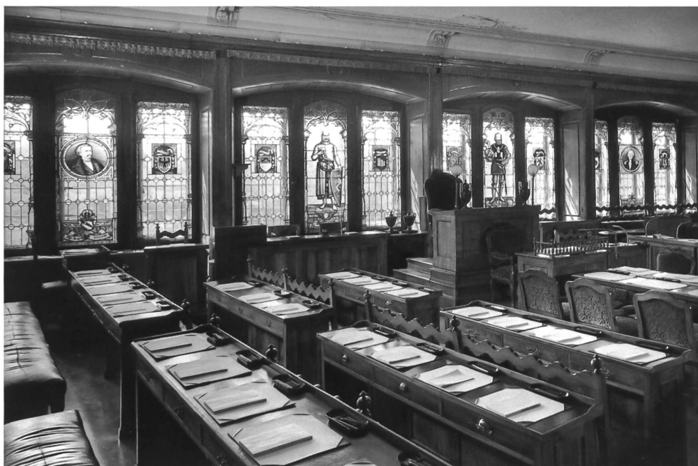
Fig. 75 Le côté sud, avant le réaménagement de la salle.

Le 25 novembre 1996, une séance réunissant une délégation du Bureau du Grand Conseil, les représentants cantonaux et fédéraux de la conservation des biens culturels, l'expert désigné, l'architecte cantonal ainsi que les architectes mandatés a permis de faire prendre conscience à chacun de la difficulté qui existe à concilier un aménagement répondant à un cahier des charges établi, avec les exigences de la conservation du patrimoine. Il faut établir une hiérarchie dans les exigences sur le plan de l'histoire et de l'usage, tout en tenant compte de l'exiguïté de la salle.