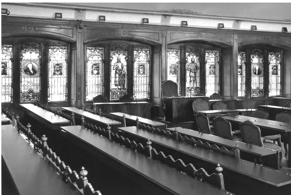
Fig. 76 Le même côté après transformation.

difficultés insurmontables. En effet, la géométrie de la salle, l'encombrement des bancs et la disposition du mobilier réduisent considérablement les possibilités d'améliorer l'aménagement des places, à savoir donner un pupitre à chaque député.