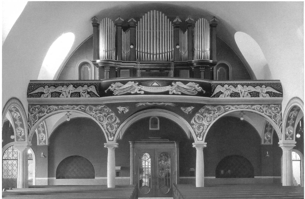
Fig. 84 Semsales, église; orgue de H. Wolf-Giusto (1926). Remarquable unité de la tribune et du buffet d'orgue, conçus par F. Dumas (1922-26). Peintures de Gino Severini. – Semsales, Pfarrkirche; beachtliche Einheit zwischen Innenraum (F. Dumas 1922-26), Emporendekoration (G. Severini) und dem Gehäuse der Orgel von H. Wolf-Giusto (1926).

Les Monuments d'art et d'histoire de la Suisse.