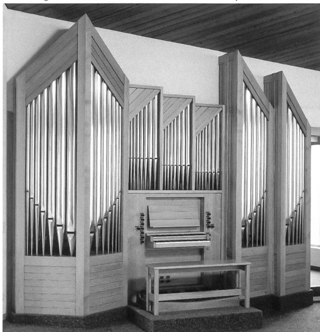
Fig. 86 Brünisried, chapelle; orgue de Ayer-Morel (1981). Cet instrument, dont la composition des jeux et la taille des tuyaux s'inspirent de la tradition moosérienne, reprend aussi une disposition typique des corps sonores, avec le Positif placé entre les deux parties du Grand Orgue. – Brünisried, Kapelle; die dispositions- wie messenmässig an A. Mooser anlehrende Orgel (Ayer [&] Morel, 1981) übernimmt auch die typische Werk-aufstellung mit dem Positiv zwischen den beiden Hauptwerkteilen.