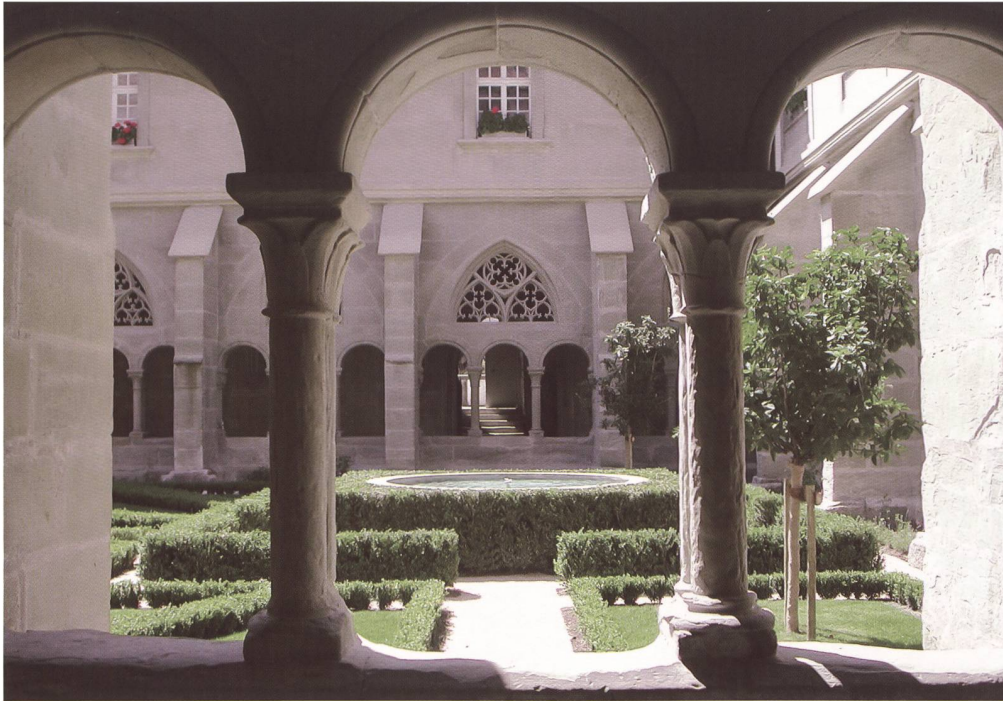
Fig. 122 Le coeur du monastère. Fig. 122 Das Herz des Klosters.

Quant à la bande végétale qui court, entre les contreforts des voûtes, au pied des parois claustrales, elle se compose à l'arrière, de rosiers buissonnants de variétés anciennes provenant de Rosa Bourbon , Sempervirens , Centifolia , Gallica , Damascena et Alba ainsi que de pivoines arborescentes ( Paeonia suffruticosa ) et à l'avant, de coussins de lavandes ( Lavandula angustifolia «Dwarf Blue») et de buis.