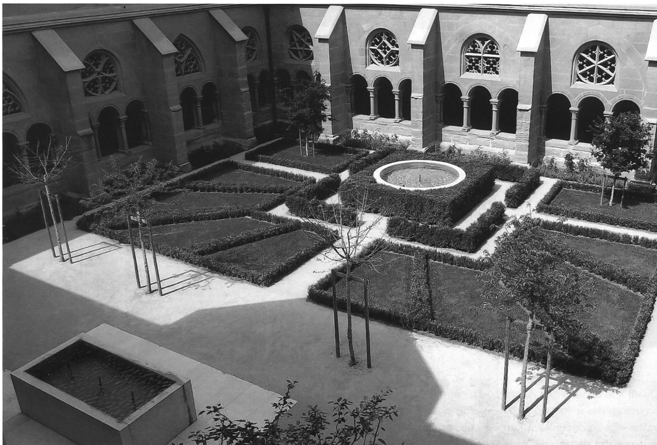
Fig. 121 Le nouvel aménagement depuis le sud-est. Abb. 121 Der neu bepflanzte Garten von Südosten.

cheminements du préau, s'il permet une circulation douce et aisée, il participe également à réchauffer l'effet d'une lumière quelque peu durcie par la molasse omniprésente.