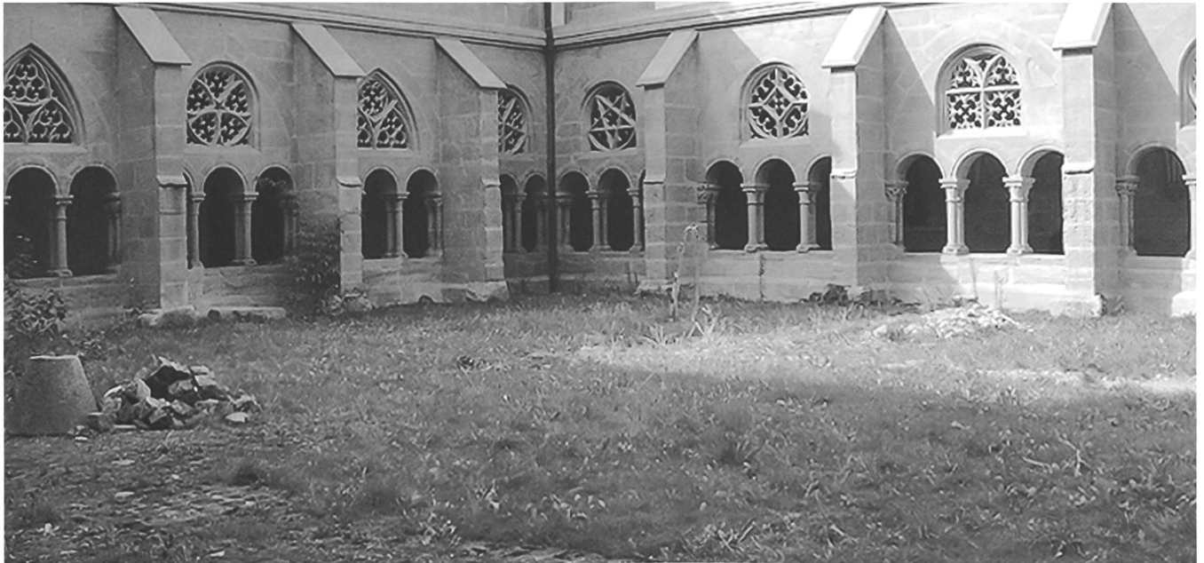
Fig. 120 Le préau avant les travaux d'aménagement. Abb. 120 Der Garten vor der Erneuerung.