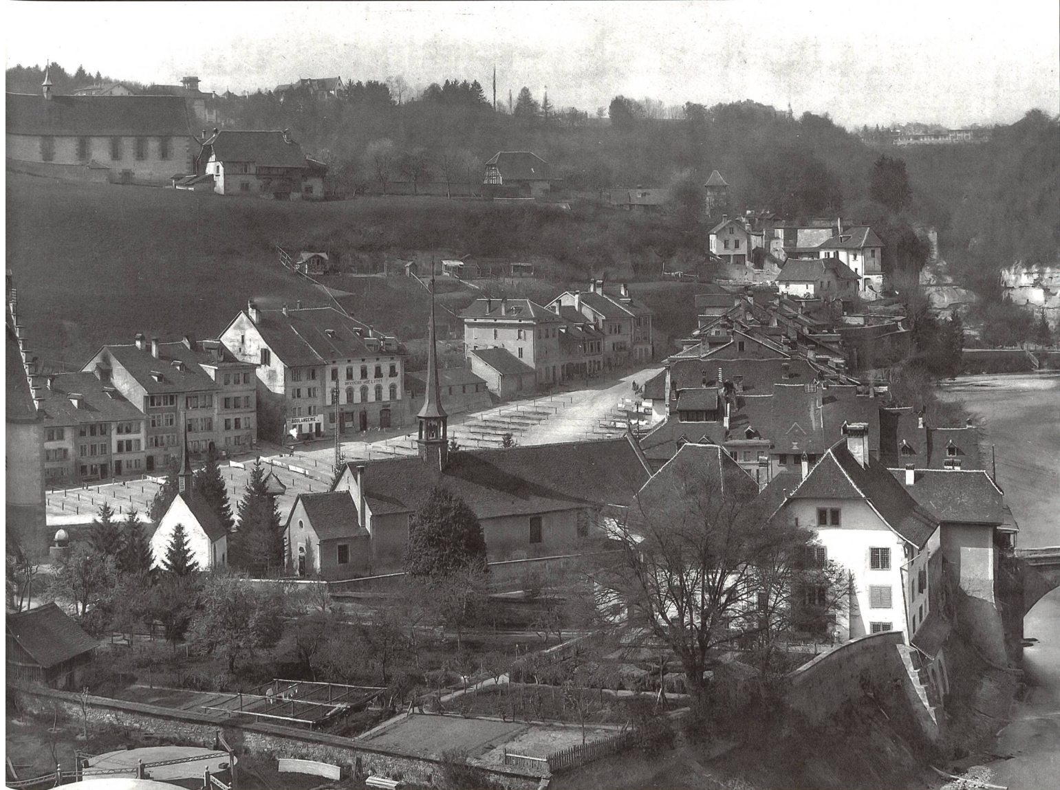
Fig. 10 Le site de la commanderie au début du XX e siècle. – L'ancien pré des Hospitaliers, transformé en jardin, s'étire jusqu'aux gazomètres de l'usine à gaz. On distingue sur l'angle gauche le bûcher construit par l'Etat vers 1831, puis la chapelle-ossuaire Sainte-Anne, l'église Saint-Jean avec sa sacristie de chevet et surtout la galerie de liaison avec la dépendance – probablement l'hospice – dont on ne perçoit que le toit en pavillon, puis la résidence des commandeurs et la cure à l'entrée du pont de Saint-Jean.

ce chemin? Les ont-ils chargés sur une barque? On le voit, le transfert des Hospitaliers doit être intimement lié au développement des «ponts et chaussées» de Fribourg 11 .