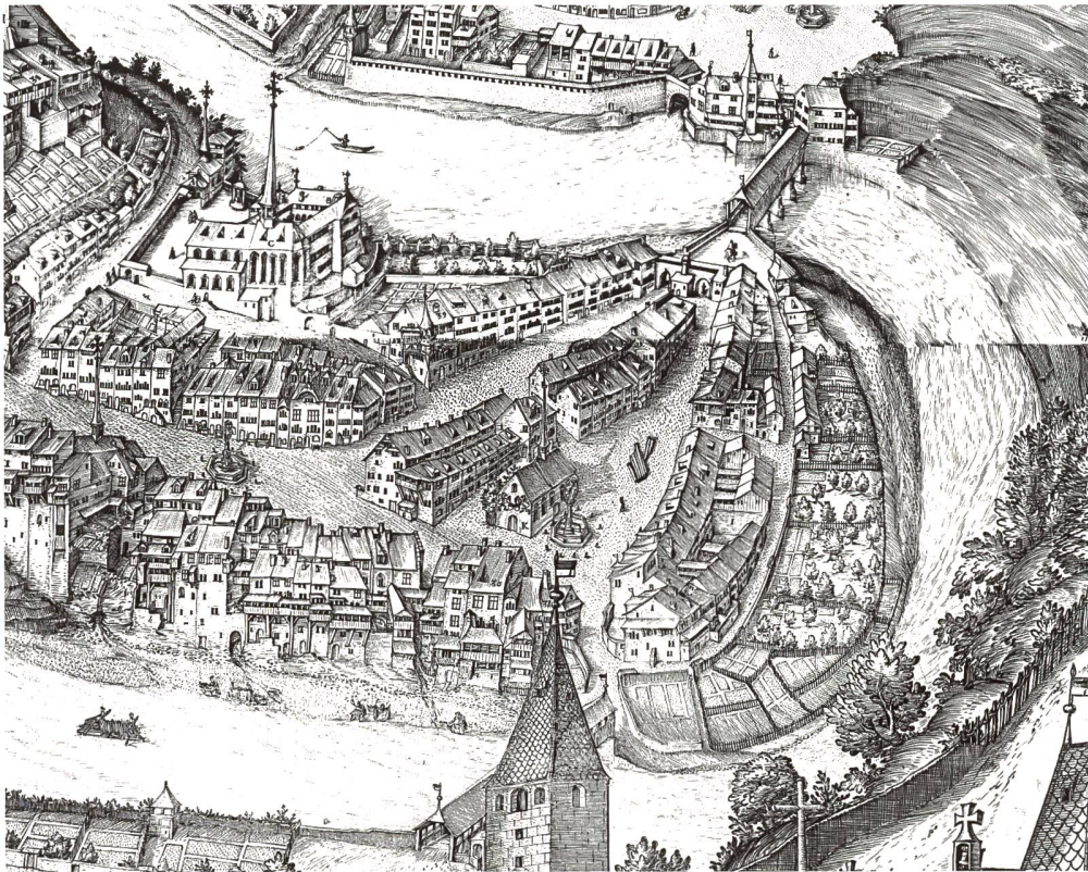
Fig. 9 La place du Petit-Saint-Jean, en 1606, d'après Martin Martini, avec la première chapelle des Chevaliers de Saint-Jean de Jérusalem, à mi-chemin entre le pont de Berne et le pont du Milieu. – Confiée en 1580 aux Augustins, dont on voit le couvent dominant le quartier de l'Auge, ce sanctuaire, qui avait desservi jusqu'en 1259 le premier établissement des Hospitaliers à Fribourg, fut rasé en 1832.

menacée, se trouva un puissant protecteur: Pierre de Savoie avec qui Hartmann de Kibourg fut amené à s'entendre pour une paix de compromis en 1256 8 .