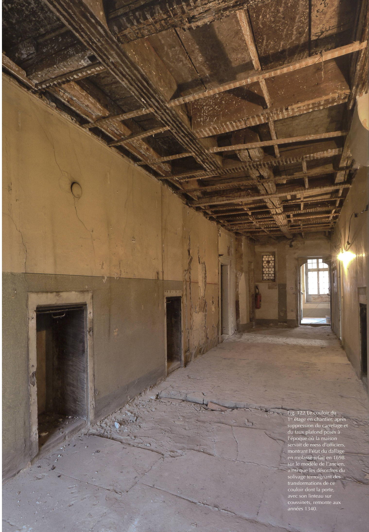
Fig. 122 Le couloir du 1 er étage en chantier, après suppression du carrelage et du faux plafond posés à l'époque où la maison servait de mess d'officiers, montrant l'état du dallage en molasse refait en 1698 sur le modèle de l'ancien, ainsi que les désordres du solivage témoignant des transformations de ce couloir dont la porte, avec son linteau sur coussinets, remonte aux années 1340.