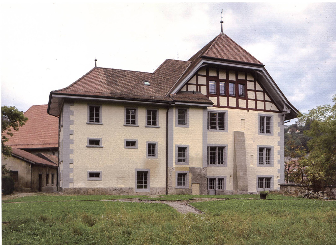
Fig. 124 La façade côté jardin après restitution d'un crépi avec badigeon jaune ocre et chaîne d'angle harpée gris bleu, correspondant à l'aspect des façades en 1700, à une époque où l'annexe sud-est, moins profonde, à deux niveaux, était encore flanquée d'un four hors-œuvre. Après la reconstruction de cette annexe en 1864, le bâtiment fut probablement repeint dans un ton plus ocre et plus vif. La restauration aboutit à un état inédit de la bâtisse, au service de sa cohérence architecturale et de son intégration dans un contexte bâti lui-même restauré.

n'ont toutefois pas permis de déterminer la forme précise du décor. Dans l'objectif d'une harmonisation avec les chaînages en pierres taillées des façades de l'annexe, la décision a été prise de restituer des chaînes d'angles harpées. Le crépi grossier projeté au balai sur la façade sud et celles des annexes a été maintenu compte tenu de son état de conservation. Dans l'objectif d'une intégration de l'ensemble, le badigeon appliqué sur les façades du corps de bâtiment principal a été étendu sur les façades des annexes bien que celles-ci n'aient jusqu'ici jamais encore connu cette teinte (fig. 95 et 124).