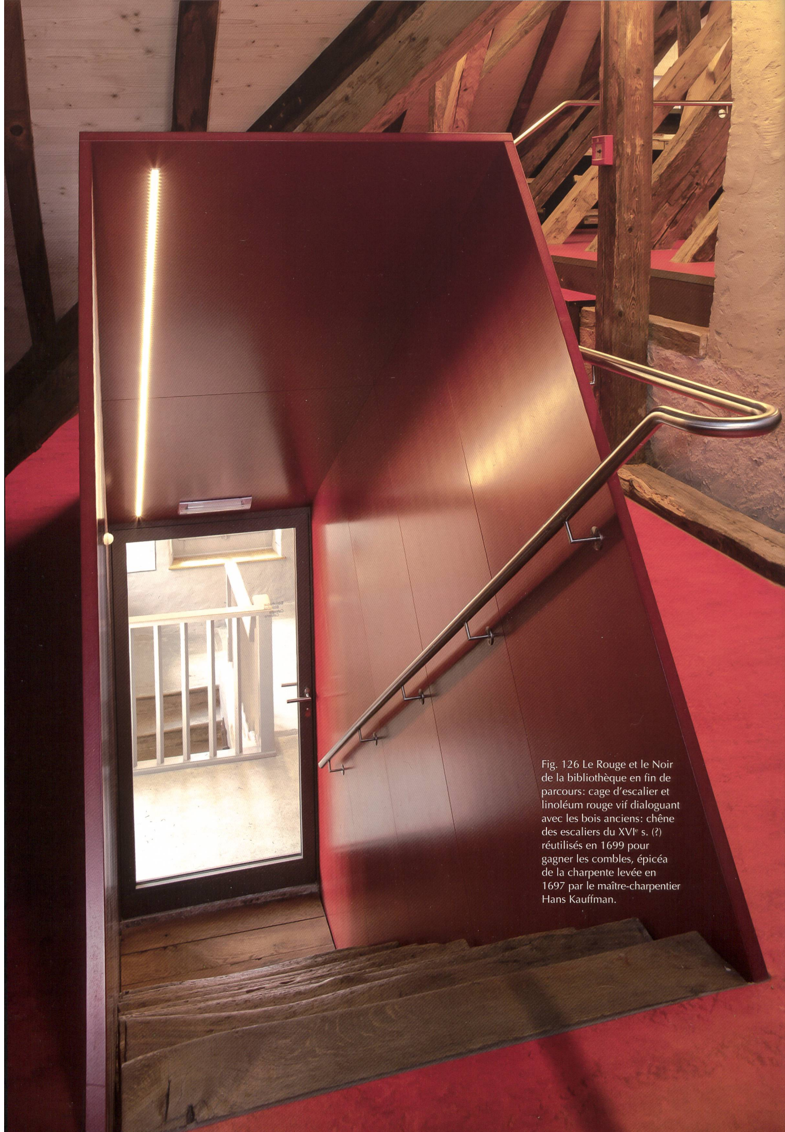
Fig. 126 Le Rouge et le Noir de la bibliothèque en fin de parcours: cage d'escalier et linoléum rouge vif dialoguant avec les bois anciens: chêne des escaliers du XVI e s. (?) réutilisés en 1699 pour gagner les combles, épicea de la charpente levée en 1697 par le maître-charpentier Hans Kauffman.