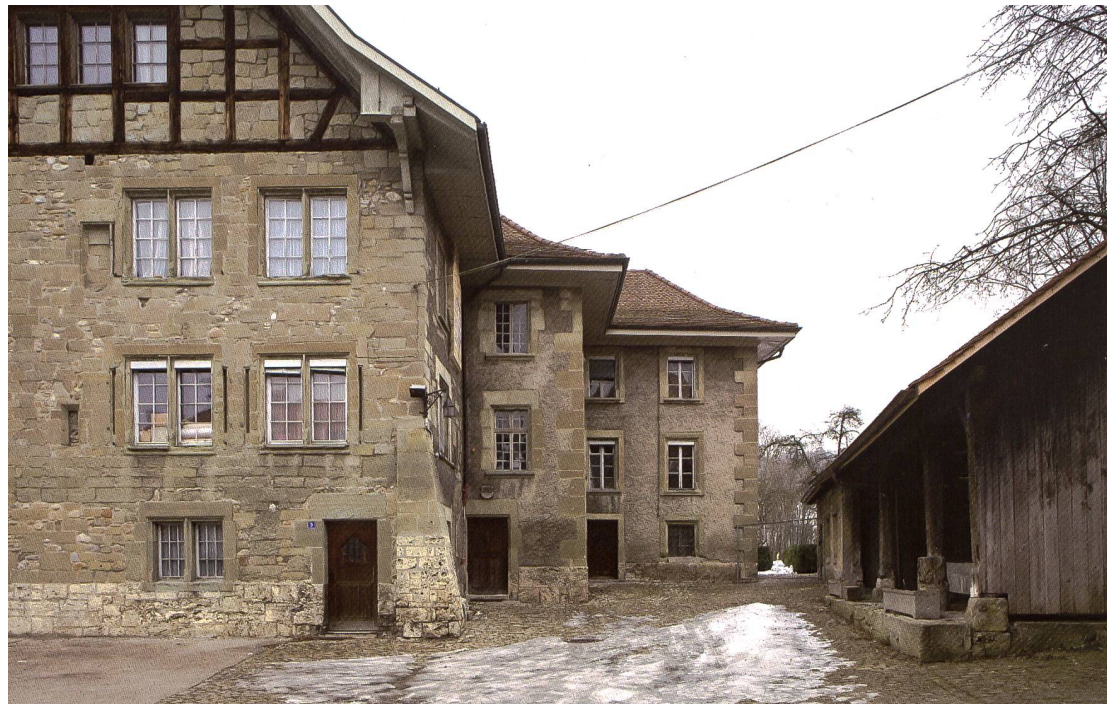
Fig. 123 Une unité de façade trompeuse et trois entrées pour trois fonctions: mess des officiers de la caserne de la Planche (accès au bureau de l'école de recrues par la porte percée au XIX e s. dans la façade ouest), commanderie (tour d'escalier de 1699) et maison de correction (annexe sud-est de 1864).

la Sarine n'a par contre pas été touchée, sans doute pour éviter les coûts d'un difficile montage d'échafaudage. Suite à un ravalement énergique, la surface frontale des encadrements en molasse des ouvertures s'est trouvée placée en retrait des moellons de la maçonnerie mise à nu. Par la force des choses, une des façades, celle surplombant la rivière, a été conservée, au sens strict du terme. Les autres ont, par contre, pris un aspect qu'elles n'avaient jusqu'ici pas encore connu. Le corps de bâtiment principal présentait ainsi, avant l'intervention de 2012, une composition de façades inédite: une façade avec un enduit dégradé et un badigeon délavé; deux façades aux maçonneries dégagées; une façade avec un enduit grossier. Quels choix faire face à une telle situation? Comment présenter les options prises en termes de «conservation» et «restauration»?