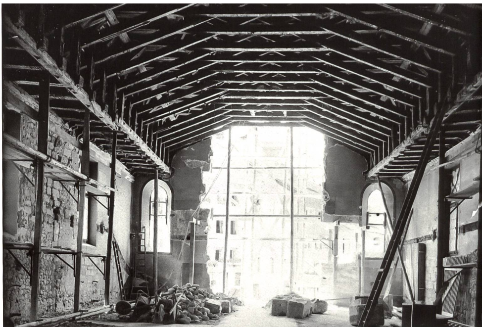
Fig. 167 Rénovation de la nef de l'église Saint-Jean en 1951, après démolition de la tribune et de la galerie des prisonniers dont on distingue encore tout à droite la porte d'accès, liant autrefois l'église à l'hospice et à la commanderie.