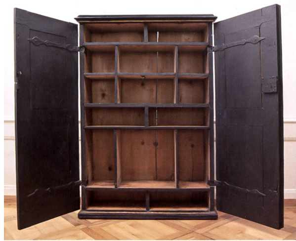
Fig. 98-101 Intérieur de l'une des deux armoires d'archives de l'Évêché de Lausanne, 1663, réservée aux registres et aux livres, alors que son pendant contenait les actes isolés; à dr., détails des casiers prévus pour les documents issus du Saint-Siège («ROMA»), de la Nonciature établie à Lucerne («LVCERNAE») et du décanat d'Estavayer-le-Lac («DECAN: STAVIACEN»).