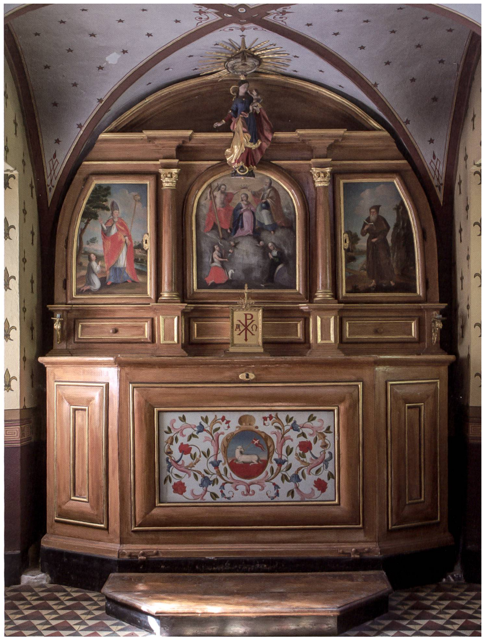
Fig. 93 Autel dédié sans doute à la Vierge couronnée par la Trinité, à saint Jean-Baptiste et à sainte Anne (?), accessoirement à saint Claude et à saint Antoine, vers 1720, bois sculpté, peint en faux bois et partiellement doré, initialement polychromé; peintures sur panneau; appliques d'origine, en fer forgé et doré; Vierge à l'Enfant en bois sculpté et polychromé, ajoutée au centre de l'entablement; petit tabernacle du début du XX e siècle; devant d'autel d'origine, à rinceaux et médaillon, représentant l'Agneau de Dieu; 265 x 210 cm (Chapelle du manoir de Plaisance à Riaz). – Le retable marial, meublant l'oratoire voué de Plaisance, montre notamment saint Jean-Baptiste, patron de l'Ordre de Malte, et peut-être sainte Anne, patronne de la mère de Claude-Antoine Duding qui a fait peindre sur les ailes ses deux protecteurs, saint Claude, archevêque de Besançon, et saint Antoine Ermite. La polychromie d'origine et les peintures figurées ont probablement été réalisées par l'atelier Bräutigam de Bulle.

Deuxièmement, il constata bien vite et déplora l'extrême pauvreté de la mense épiscopale. Dressant l'état de son diocèse historique (composé de 150 000 catholiques et de 250 000 «hérétiques»), il rappela au pape en 1724 que son territoire avait été diminué des deux tiers à la Réforme et son temporel réduit à néant. Conscient de l'impossibilité de recouvrer ses biens, il n'eut de cesse, en 1714 (pour son oncle), en 1724, en 1734, dans de nombreux mémoires et d'innombrables lettres, de revendiquer des bénéfices, avant tout auprès du Saint-Siège, comptable de sa nomination, mais aussi auprès de l'empereur et du roi de France. Sa demande la plus pressante envers Rome fut la suppression de la chartreuse de la Part-Dieu, dont les biens seraient revenus à l'Évêché. Le nonce Passionei lui répondit que cet ordre était trop puissant pour être spolié 75 . Seul le roi de France accéda à ses prières : en 1728, Louis XV lui attribua en commende l'abbaye Saint-Vincent de Besançon 76 , ce qui améliora peu sa situation. En désespoir de cause, il finit pas lever une taxe sur les divers bénéfices de son diocèse 77 . Toujours est-il que sa pauvreté