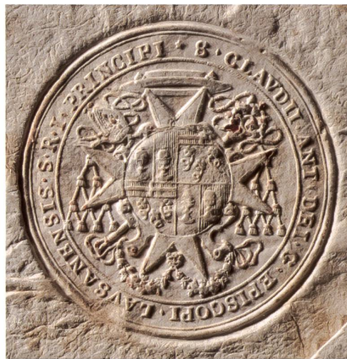
Fig. 92 Empreinte de l'un des sceaux ronds armoriés de M re Claude-Antoine Duding, évêque de Lausanne, 1718, papier, Ø 40 mm (AEvF). – Frappé au bas d'une lettre adressée à la Supérieure du monastère de Montorge le 20 octobre 1718, ce sceau correspond exactement à la matrice conservée au Musée d'art et d'histoire de Fribourg et datant de 1717 probablement (MAHF 3753).

dant, le pape Clément XI, qui estimait que la nomination à l'Évêché de Lausanne lui revenait de droit et que les prétentions du duc de Savoie n'avaient aucun fondement solide, rejeta une nouvelle fois la candidature d'Antoine d'Alt.