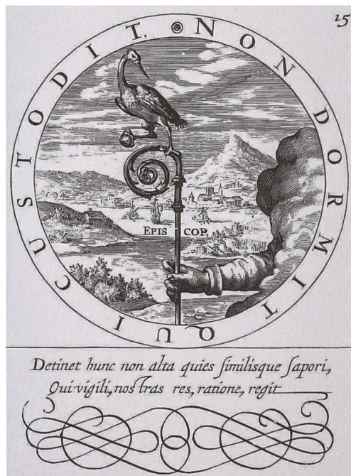
Fig. 96 Crispin de Passe l'Ancien, «Non dormit qui custodit», gravure sur cuivre, 15 e emblème de l'ouvrage de Gabriel Rollenhagen, «Selectorum emblematum centuria secunda», publié à Utrecht et à Arnheim en 1613. – Montrant la grue perchée sur une crosse épiscopale, cette gravure, qui n'a pas servi de modèle au peintre employé par Claude-Antoine Duding, affiche clairement la signification de la devise : la vigilance de l'Église.

Concernant les armes, il propose une variante tout à fait inédite de celles de M br de Strambino. Il écartèle aux 1 et 4 Évêché de Lausanne, aux 2 et 3 losangé d'azur et d'or, qui normalement occupe les quartiers 1 et 4 des armes de Strambino. Rappelons que, lui-même, cet évêque n'écartela jamais ses armes avec celles de l'Évêché; Pierre de Montenach fut le premier à le faire 107 .