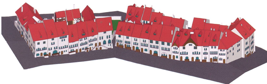
Fig. 115 Le rang nord-est de la rue de la Samaritaine en 1606, plan de coupe à commande numérique (CNC).

«Frima-Formations» est l'un des premiers centres de formation dans le canton de Fribourg à avoir employé la technologie de l'impression tridimensionnelle (3D). Cette technologie est arrivée sur le marché en fin de construction de la maquette, mais elle a été largement utilisée pour tous les éléments complémentaires tels que personnages, animaux, charrettes, végétation, troncs d'arbres, palissades et autres éléments décoratifs.