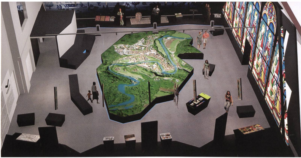
Fig. 116 Maquette 3D de l'«Espace 1606».

La vue panoramique que Martin Martini a réalisée de la ville de Fribourg en 1606 était déjà un outil de communication moderne pour son temps. Un parallèle peut être tiré avec l'«Espace 1606». Grâce aux nouvelles technologies, des reconstitutions virtuelles de lieux et de bâtiments disparus sont possibles. De plus, on pourra y ajouter des interactions avec les visiteurs en fonction des besoins et de l'évolution des technologies multimédias. Il s'agit donc d'un projet évolutif utile également pour imaginer l'avenir de la vieille ville.