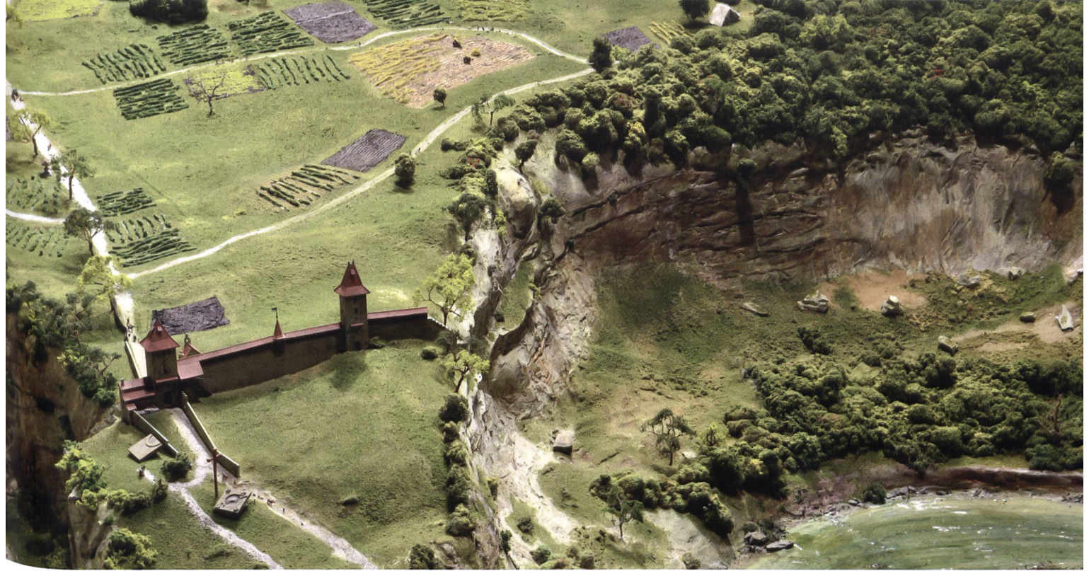
Fig. 114 La tour-porte de Bourguillon et la tour poudrière en 1606, détail de la maquette.

modules de 84 cm x 84 cm a été établi. Chaque module de la maquette a été construit en profil bois tout en épousant la topographie actuelle. Afin d'en diminuer le poids, les éléments ont été remplis avec de la mousse polyuréthane expansive. La partie extérieure a été recouverte de plâtre pour permettre de sculpter et de former des rochers, des zones de pâturages, des terrasses, des routes et des cours d'eau.