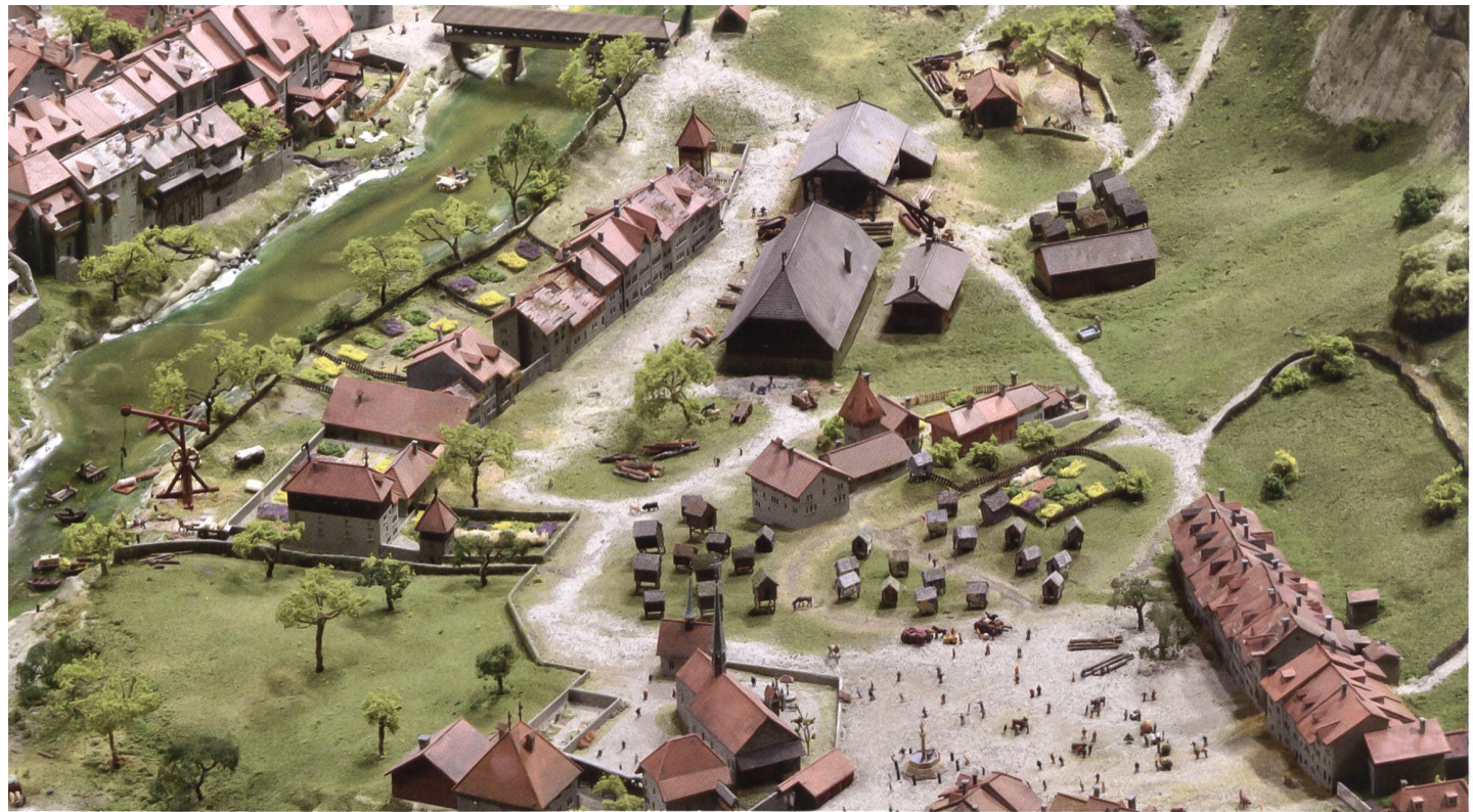
Fig. 112 Le quartier des Planches en 1606, vu à vol d'oiseau, détail de la maquette.

convention à long terme, a pu investir les fonds récoltés dans l'aménagement des espaces nécessaires.