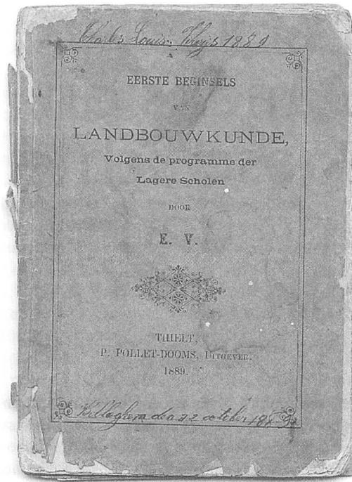
Schulbuch (E.V. Eerste beginsels van landbouwkunde Volgens de programme der Lagere Scholen. Thielt 1889)

die Kulturgeschichte (der Schulbücher) erweisen. Historisch-pädagogisch orientierte Schulbuchforschung offenbart natürlich Prozesse und Strukturen, die zur schulischen Kultur gehören, aber diese könnten durchaus als kondensierte "Grammatiken" der Modernisierung und Globalisierung der Schlüssel zum besseren Verständnis der gesellschaftlichen Entwicklung der vergangenen Jahrhunderte sein. Dies gilt auf jeden Fall dann, wenn Schulbücher in ihrer Langzeitentwicklung erforscht werden (z.B. Liedtke 1993 und 1997), was zum Anlass für einen Vergleich mit diachronischen Entwicklungen der materiellen Kultur der Gesellschaft genommen wird (Gaus 2001). Dies ist ein weiterer Grund, die interdisziplinäre Schulbuchforschung voranzutreiben. In diesem Sinn versuchen wir gemeinsam mit den französischen und spanischen Behörden ein "pan-europäisches" Projekt zu entwickeln.