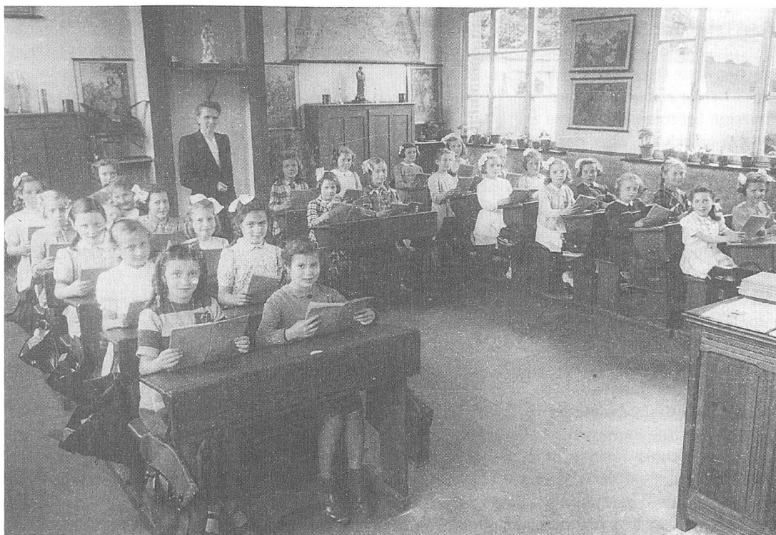
Die "Grammatik" von Schulung und Verschulung: eine Klasse in der Primarschule für Mädchen: Moerbeke-Waas, ca. 1945

und auch schon davor – verkündet wurden. Aber so einfach war das alles nun auch wieder nicht, denn nicht nur die Ankündigung eines Wissensniveaus sorgte für die Inkonsistenz der pädagogischen Ideale.