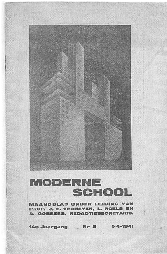
Eine der ausgewerteten pädagogischen Zeitschriften: Moderne School . Maandblad voor opvoeding en onderwijs XIV, 5(1941)

Sie sind zum Ersten eine konsistente Quelle, weil sie sich sehr regelmässig mit der Klasse befassen (wöchentlich, halbmonatlich). Natürlich ist es so, dass Zeitschriften erscheinen und wieder eingestellt werden. Eine "Repräsentativität" kann durch eine Auswahl garantiert werden, die sich auf unterschiedliche und nicht nur ideologische Kriterien verlässt. Diese Kriterien können einen breiten Fächer von Differenzen abdecken: politische Einstellung, didaktischer Einfluss, pädagogische Orientierung,