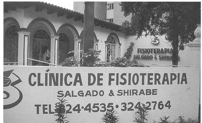
Die Privatklinik unserer Kollegen in Londrina.