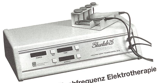
Ultraschall, Hochfrequenz Elektrotherapie