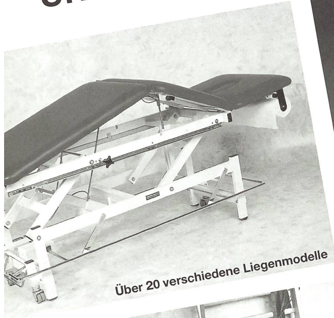
Über 20 verschiedene Liegenmodelle