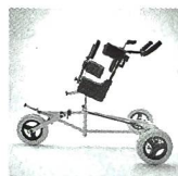
TORO Magic Walker