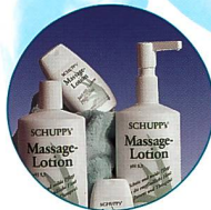
Produkte und Verbrauchsmaterial