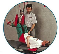
Sling Exercise Therapy

Verlangen Sie unseren Gratis-Gesamtkatalog!