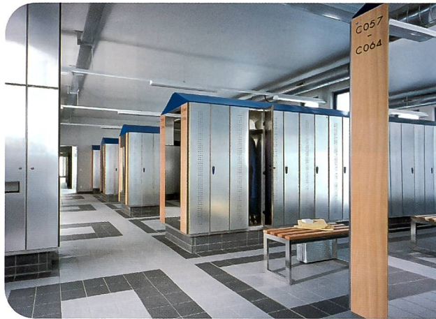
Vom individuellen 3D Plan zum fertigen Projekt – alles aus einer Hand!