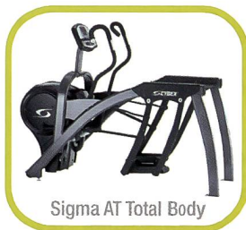
Sigma AT Total Body