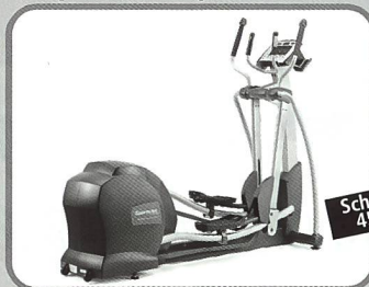
Elliptical mit verstellbarer Schrittlänge