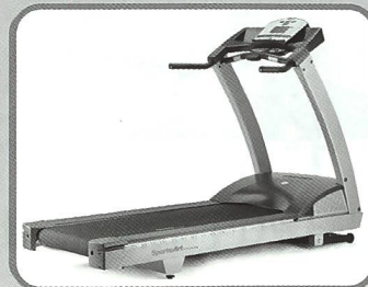
Laufband mit Reversefunktion