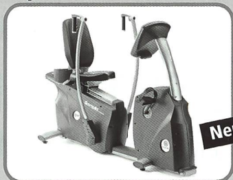
Liegeergometer mit Oberkörpertraining