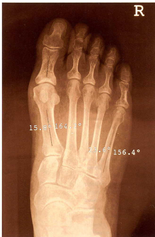
Fig. 2: Radiographie numérisée du pied droit d'une patiente présentant un névrome plantaire du 3 ème espace.

L'examen musculo-squelettique est essentiel. Le diagnostic est essentiellement clinique et l'examen paraclinique permet de le confirmer. La perte de sensibilité de l'espace interdigital est indiquée par le patient lors de la palpation du pied qui permet de retrouver un point douloureux précis entre deux orteils. Une pression plantaire à l'endroit supposé du névrome et la pression latérale simultanée de l'arche métatarsienne, à la