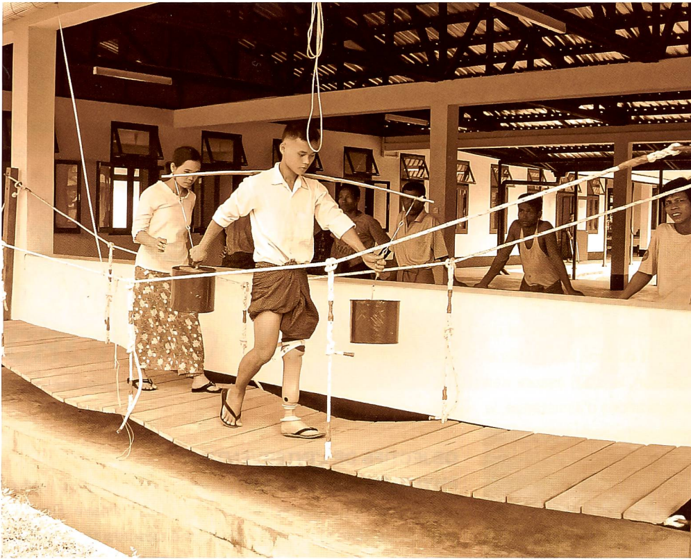
Birmanie 2004: rééducation fonctionnelle.