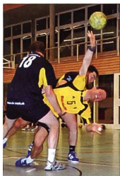
«Schmerz beim Sport»