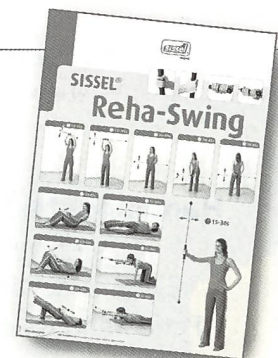
inklusive Übungsposter mit 12 Übungen