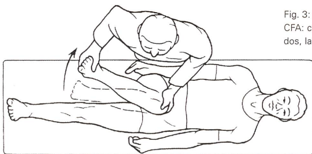
Fig. 3: Examen du symptôme du CFA: chez le patient allongé sur le dos, la hanche tachetée présente également une rotation interne et est en adduction. Le labrum est comprimé entre le col du fémur et le rebord acétabulaire entraînant une lésion responsable des douleurs de l'aîne.

également après que le patient ait été assis en position basse (canapé, voiture).