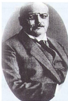
Der deutsche Arzt Alois Alzheimer beschrieb 1906 als erster wissenschaftlich die Alzheimer-Demenz. | Le Docteur Alois Alzheimer a été le premier, en 1906, à décrire la maladie d'Alzheimer de manière scientifique.

La maladie d'Alzheimer est une longue maladie dégénérative, accompagnée d'une atrophie cérébrale et de modifications typiques telles que des plaques amyloïdes 1 et des tangles neurofibrillaires 2 . La maladie commence dans l'hippocampe, dans le lobe temporal où se situe la mémoire. Son apparition est rare avant 60 ans. La fréquence augmente de manière exponentielle après 65 ans: 8% des personnes âgées de 65 ans et plus sont atteintes de démence. Les statistiques parlent d'un tiers chez les personnes âgées de 90 ans et plus. La