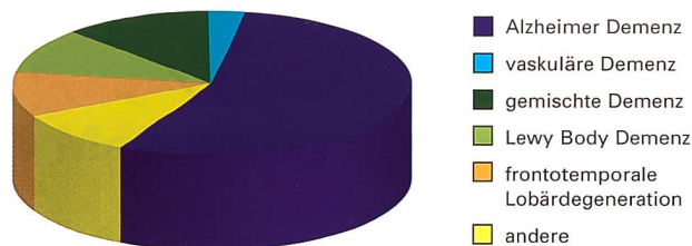
Abbildung 2: Häufigkeit der verschiedenen Demenzformen

In der Schweiz setzt sich die Alzheimervereinigung dafür ein, dass Menschen mit Demenz medizinisch und menschlich optimal betreut werden.