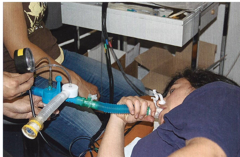
Atemmessung für die Bachelor-Arbeit. | Mesurer les effets des appareils respiratoires.

I l y déjà presque deux ans que je vous ai parlé de ma formation. Entre-temps, depuis le cours PHY 06 (première année du cursus de physiothérapie à la HES de Berne), nous avons pu acquérir une expérience pratique grâce à presque quarante semaines de stage. Ceux-ci alternaient avec des modules suivis à l'école, ce qui à mon avis rend la formation très plaisante. Il nous reste maintenant à suivre les derniers modules de formation théorique avant de commencer en