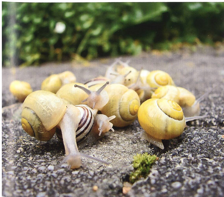
«Reformstau im Gesundheitswesen» | «l'enlisement des réformes dans le secteur de la santé»