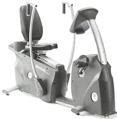
SportsArt FITNESS Krafttrainingsgeräte