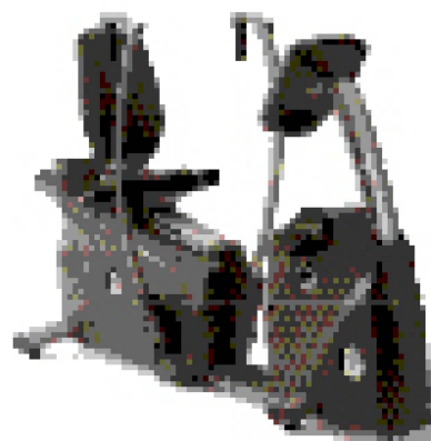
Shark Fitness Cardio-Stepper