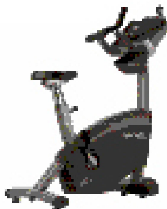
Shark Fitness Liepfergeräte Q100-020000