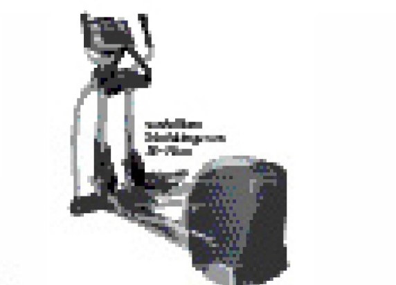
Physio Physio 120000

verstellbar 200kg Belastung 12-Programme