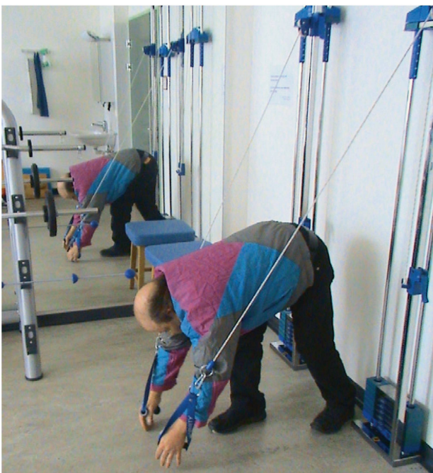
Foto 1: Überdosierung in der MTT bei einem Schmerzpatienten mit körperlicher Wahrnehmungsstörung und Leistenschmerzen. | Photo 1: Surdosage dans la TME chez un patient souffrant de troubles de la perception corporelle et de douleurs inguinales.

Je travaillais à l'époque dans un cabinet de physiothérapie à Wedding. C'est l'un des quartiers où la proportion d'immigrés est la plus importante: 31,5% de la population. Mon patient venait du Kosovo et avait plus de 50 ans. Lors de l'anamnèse, j'avais remarqué son manque de concentration et son faible niveau d'allemand. Il était venu me consulter parce qu'il éprouvait une douleur à la cheville lorsqu'il marchait, suite à une fracture malléolaire survenue trois mois auparavant. Après l'opération, tout s'était remis, mais la musculature du pied était un peu tendue et douloureuse. J'ai donc commencé par la détendre. Dès la première séance, il s'est endormi. Chez lui, il dormait mal, m'a-t-il dit. Pendant une des séances suivantes, je lui ai demandé pourquoi il était venu en Allemagne. Il m'a alors raconté son histoire en détail. Il avait été expulsé, emprisonné et torturé pour des raisons ethniques. J'étais très impressionné. Je n'avais jamais entendu un récit aussi réaliste de ce qui s'était passé pendant