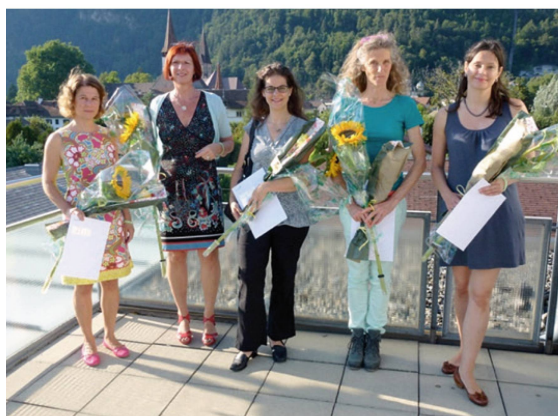
Erste MAS-Absolventinnen in «pelvic physiotherapy».

Diesen Sommer haben die ersten sechs Physiotherapeutinnen in der Schweiz den Master of Advanced Studies (MAS) in pelvic physiotherapy abgeschlossen. Durchgeführt wird die Weiterbildung am SOMT in Interlaken, einer in Holland anerkannten Fachhochschule. Mit der Spezialisierung werden Kenntnisse und Fähigkeiten in der Prävention, Diagnostik und Therapie bei Frauen, Männern und Kindern mit Funktionsstörungen im urogenitalen, anorektalen, sexuellen und muskuloskelettalen System gelernt und angewendet. Die Muskelfunktionsuntersuchung des Be-