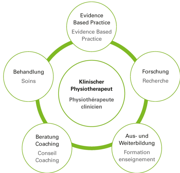
Abbildung 3: Aufgaben des klinischen Physiotherapeuten. | Illustration 3: Tâches du physiothérapeute clinicien.