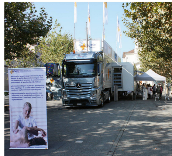
Der physiobus 2013 in Carouge. | Le physiobus 2013 à Carouge. | Il physiobus 2013 in Carouge.

Il Consiglio Centrale ha fondato la Commissione per la promozione della salute 15 anni fa. L'obiettivo era quello di portare avanti il dibattito della promozione della salute per noi fisioterapisti e sensibilizzare l'opinione pubblica. Concretamente si trattava di questo: i fisioterapisti hanno basi di epidemiologia in