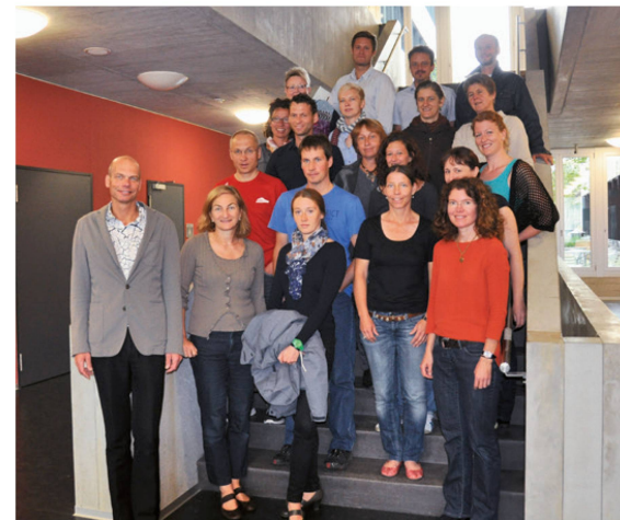
TeilnehmerInnen und DozentInnen der Physiotherapie-Summer-School 2014.