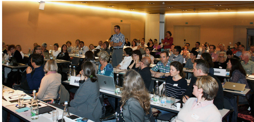
Zahlreiche Fragen der Delegierten wurden an der DV vollumfänglich beantwortet. | Les nombreuses questions des délégués ont reçu des réponses détaillées. | L'assemblea risponde in modo esaustivo a molte domande dei delegati.

insbesondere bei den Kommunikationsmassnahmen. Dies ist in Anbetracht der stetig wachsenden Anzahl von juristischen Personen ein Problem. Der Zentralvorstand schlug den Delegierten vor, dass er mit der Geschäftsstelle auf die DV 2016 konkrete Vorschläge für die Änderung der Statuten ausarbeiten wird – was mit nur einer Enthaltung durchwegs wohlwollend aufgenommen wurde.