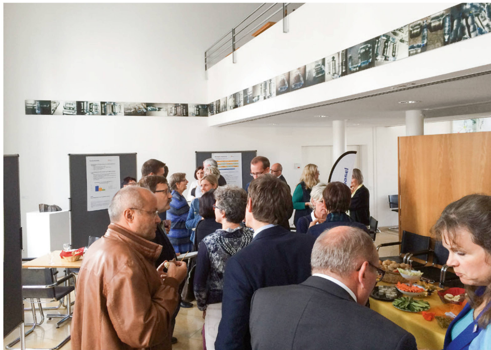
Gute Diskussionen zwischen den Politikern und Physiotherapeuten.

gungsapparat dar (Gesamtkosten, Kosten für Hospitalisation pro Tag, Kosten für ein MRI). Hospitalisation, MRI und 9x Physiotherapie werden anschliessend grafisch im Vergleich dargestellt.