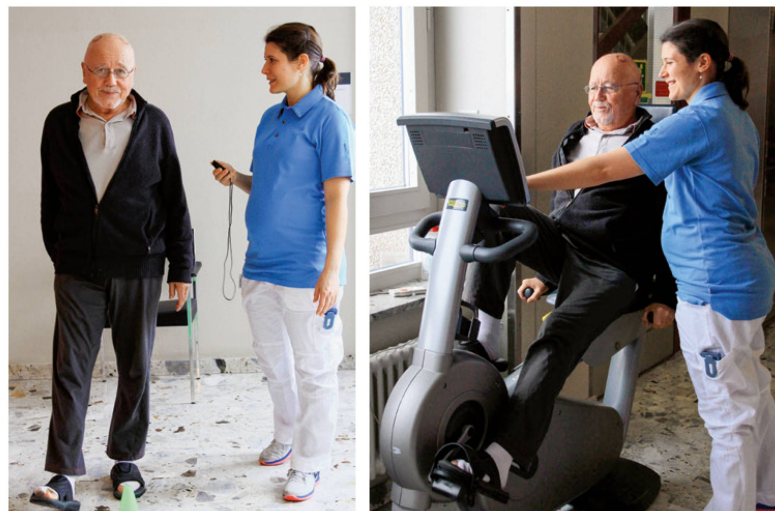
Patient beim Assessment in der präoperativen Abklärung. | Un patient lors de l'examen préopératoire.

Le but de la physiothérapie est d'évaluer l'influence des paramètres DBS sur l'équilibre, le contrôle de la posture et l'assurance de la démarche et, d'autre part, d'éviter