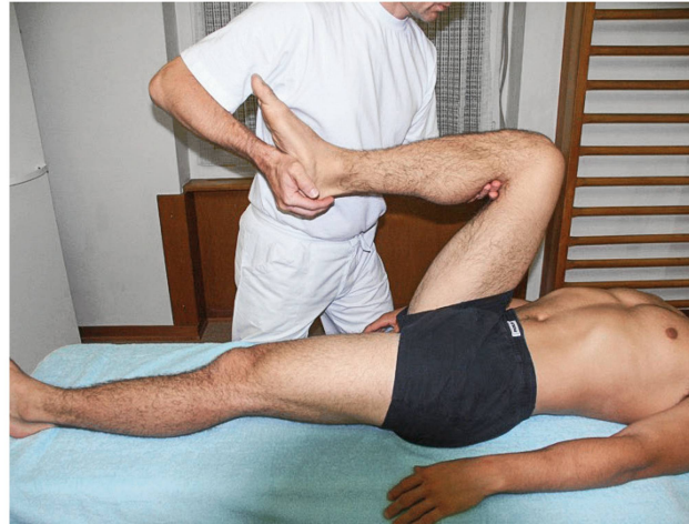
Abbildung 7: Passiver Beweglichkeitstest der Hüfte. | Illustration 7: Test de la mobilité passive de l'articulation coxo-fémorale.

Die Gelenkdysfunktionen der Iliosakralgelenke sind gekennzeichnet durch einen Schmerz im Bereich des Iliosakralgelenks, der aufgrund des hypertonen M. piriformis in die Gesässbacke ausstrahlen kann. Wenn dieser Hypertonus des Piriformis den Ischiasserv komprimiert, kann der Schmerz in Form einer Ischialgie in die untere Extremität ausstrahlen. Diese Dysfunktion kann sich auch durch Leistenschmerzen mit einer eventuellen Verspannung des Iliopsoas manifestieren, manchmal mit einer Schambeinreizung, die durch eine verschobene Symphyse begünstigt wird. Diese Symptome treten bei Belastung des Gelenks auf, beim Aufstehen vom Sitzen, zu Beginn beim Gehen, bei langem Gehen, vor allem aber beim Treppensteigen oder bei Anstiegen. Wenn die Symptome insbesondere im Leistenbereich liegen, kann die Dysfunktion der Iliosakralgelenke mit einer Dysfunktion des Hüftgelenks verwechselt werden. Die klinische Unterscheidung zwischen den beiden Dysfunktionen basiert auf mehreren Kriterien: