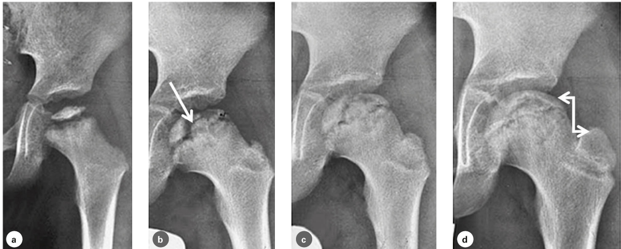
Abbildung 1: Die vier Verlaufsstadien (von links nach rechts): a) Knabe im Alter von 3 Jahren, Femurkopf im Kondensationsstadium. b) Fragmentationsstadium im Alter von 5 Jahren (Frakturlinie siehe Pfeil). c) Reparatursstadium im Alter von 7 Jahren. d) Endstadium im Alter von 9 Jahren, gutes Verhältnis von Femurkopfhöhe zu Trochanter major (Doppelpfeil). | Illustration 1: Les quatre stades de la maladie (de gauche à droite): a) Garçon âgé de 3 ans, tête fémorale au stade de condensation; b) Stade de fragmentation à l'âge de 5 ans (ligne de fracture voir flèche); c) Stade de réparation à l'âge de 7 ans; d) Stade final à l'âge de 9 ans, bon rapport entre la hauteur de la tête fémorale et le grand trochanter (double flèche).