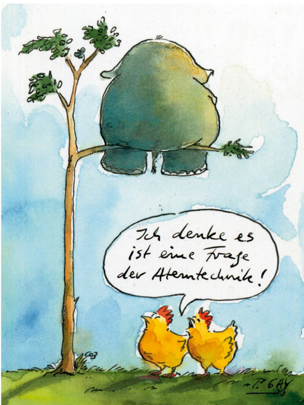
Abbildung 2: Humorvolle Motivation, um Patienten für die komplexen, konzentrativ-anstrengenden Atemtechniken zu gewinnen. | Illustration 2: L'humour permet de motiver les patients à pratiquer des techniques respiratoires complexes qui demandent beaucoup de concentration et d'efforts. [Ça doit être une question de respiration!]