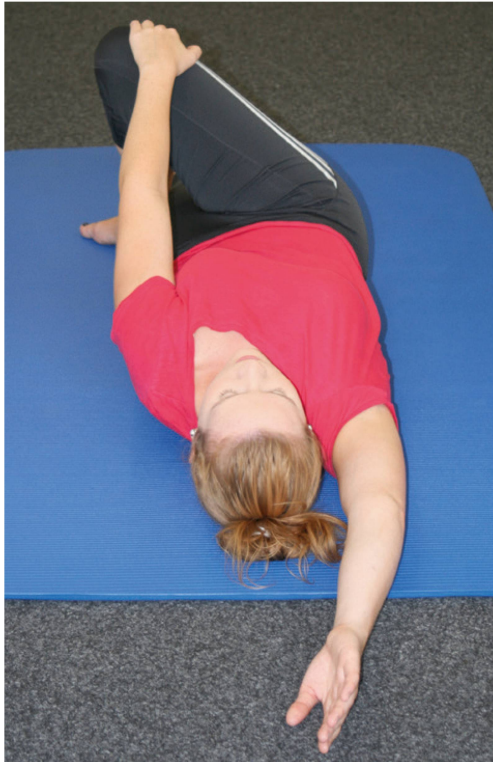
Abbildung 1: Standardisierte Ausgangsstellung für eine lumbale Problematik mit der Methode «Donsez Intrinsic Interaction Process for Physiotherapy». Intrinsisch bezieht sich darauf, dass die Patientin die korrigierenden Kräfte selbst auslöst. Interaction verweist darauf, dass die Methode global verschiedene Strukturen und Funktionen anspricht. | Illustration 1: La position de départ standardisée dans le cadre de la méthode Donsez Intrinsic Interaction Process for Physiotherapy. «Intrinsèque» décrit le fait que le patient génère lui-même les forces correctrices. «Interaction» réfère à un aspect global; il s'agit d'une méthode active qui inclut diverses structures et fonctions.

beim Bücken, ausstrahlend ins Gesäss links, das limitierend wirkt. Dieses Symptom erinnert an frühere Schmerzepisoden, die ab und zu beim längeren Bücken auftraten, und nach einer Ruhe- und Schonungszeit von zwei bis drei Tagen wieder verschwanden. Diesmal ist es aber hartnäckiger. Und als Schwangere fühlt sie sich auch oft sehr müde.