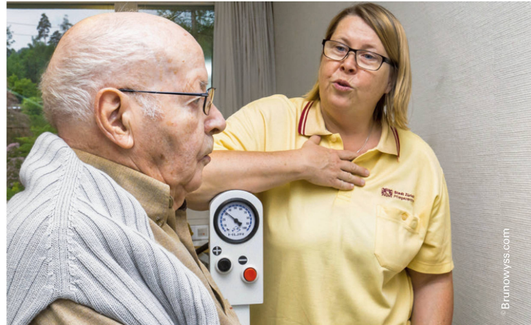
Der geriatrische Patient zeichnet sich durch Multimorbidität aus. | La multimorbidité est la caractéristique des patients en gériatrie.

possible (p. ex. pour les physiothérapeutes qui travaillent dans un cabinet), la configuration optimale est un échange d'informations relatives aux patients entre les professionnels spécialisés concernés (p. ex. avec le médecin traitant, l'Aide et les soins à domicile). Chaque discipline effectue les évaluations qui concernent sa spécialisation et se charge de saisir les informations de son domaine. L'ensemble des résultats doit être traité au sein d'entretiens interdisciplinaires.