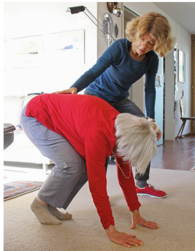
Kann die Seniorin wieder alleine vom Boden aufstehen? | La personne âgée est-elle en mesure de se relever seule?