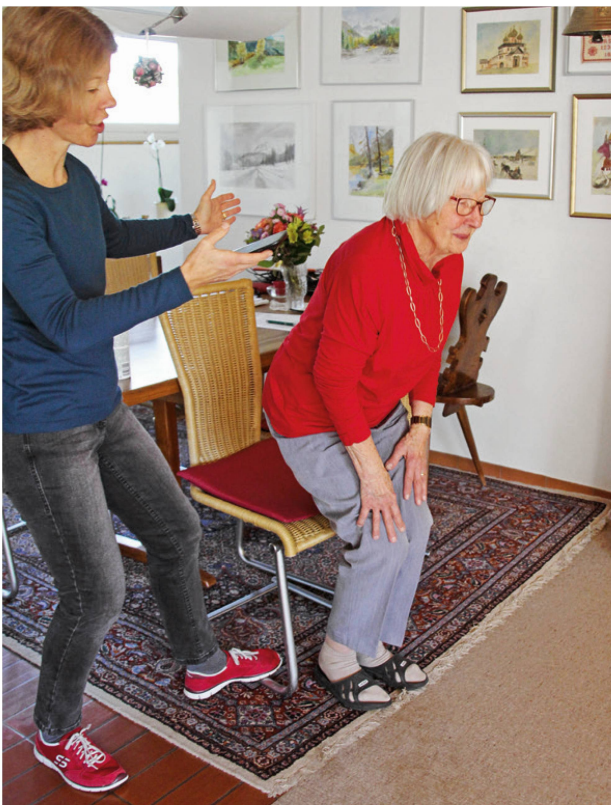
Der «Five Chair Rising Test» erfasst das Sturzrisiko. | Le «Five Chair Rising Test» permet d'évaluer le risque de chute.