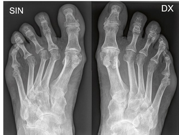
Füsse: Erosionen führen zu Deformation und sekundären Arthrosen. | Pieds: les érosions ont conduit à une déformation et à de l'arthrose secondaire.

Mit der Einführung zielgerichteter Behandlungsstrategien, die direkt ins Krankheitsgeschehen eingreifen, soll der Anteil Patienten in Remission oder mit geringer Krankheitsaktivität erhöht werden. Langfristig besteht die Hoffnung, dass sich der Outcome von Patienten mit rheumatischer Arthritis erheblich verbessert.