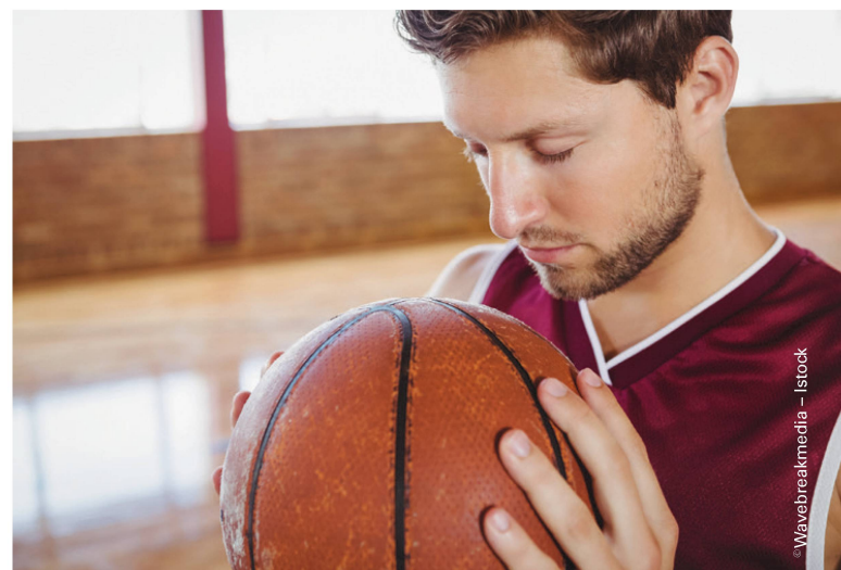
Bewegungsvorstellung beeinflusst psychologische Prozesse, die auf die Bewegung wirken. | L'imagerie motrice influence des processus psychologiques qui agissent sur le mouvement.

Parmi les effets fonctionnels en réadaptation neurologique, on trouve par exemple une avance de 1 à 23 points en faveur de l'imagerie motrice combinée à la physiothérapie ou à l'ergothérapie. Ces résultats concernent la marche et/ou les membres inférieurs dans un test de marche sur 10 mètres, dans le «Timed up and go» ou dans l'évaluation des AVC selon Fugl-Meyer. Il en va de même pour les membres supé-