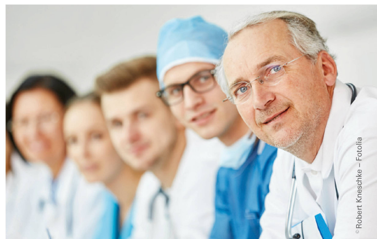
Eine direkte Kommunikation zu den Zuweisern erhöht deren Zufriedenheit. | Une communication directe avec les prescripteurs augmente leur satisfaction.

Les résultats de la saisie qualitative des données permettent de définir des mesures; le processus s'appuie sur un projet de recherche mené par des étudiants de la HES de Saint-Gall