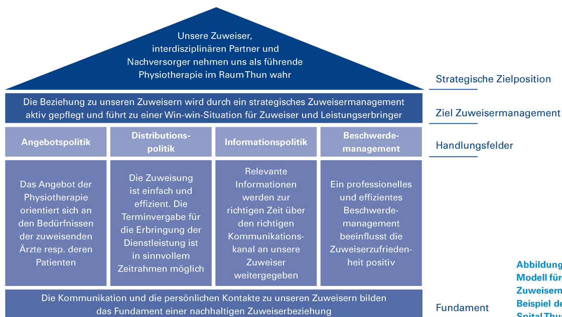
Abbildung 1: Vier-Säulen-Modell für ein erfolgreiches Zuweisermanagement am Beispiel der Physiotherapie Spital Thun.

Une catégorisation supplémentaire est indiquée afin de pouvoir prendre des mesures ciblées dans un deuxième temps. Une répartition entre les prescripteurs principaux, potentiels et problématiques est judicieuse pour évaluer le déroulement des demandes sur plusieurs années: les prescripteurs principaux présentent des nombres élevés de cas ainsi que des demandes constantes sur plusieurs années. Les prescripteurs potentiels sont des prescripteurs qui génèrent déjà un grand nombre de demandes mais qui laissent supposer un potentiel restreint en raison de leur faible constance. Si l'on constate une diminution du nombre de cas, c'est-à-dire un passage de la catégorie A à la catégorie B, voire de la catégorie B à la catégorie C, il faut en analyser les raisons. Un nombre de cas en baisse au cours des dernières années de la part de certains prescripteurs indique qu'ils appartiennent à la catégorie des prescripteurs problématiques .