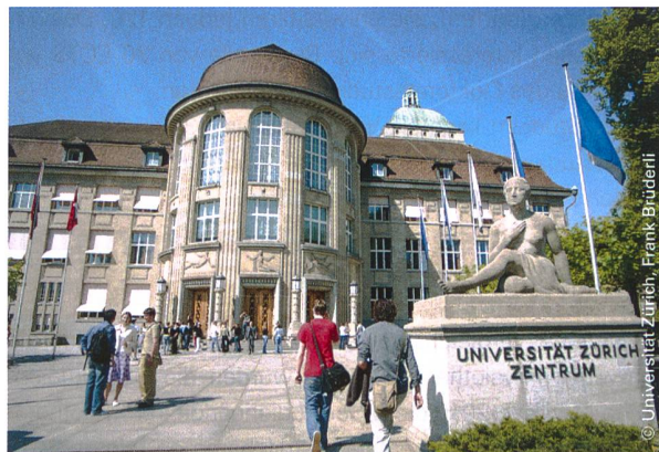
Die Universität Zürich (Bild) bietet das Doktoratsprogramm in Kooperation mit der ZHAW an. | L'université de Zurich (illustration) propose un programme de doctorat en coopération avec la ZHAW.

Grundsätzlich können sich alle interessierten KollegInnen mit einem MSc-Abschluss der Schweizer Fachhochschulen Gesundheit bewerben. Gesamtschweizerisch gilt, dass die fachhochschulischen MSc-Studiengänge maximal 90 ECTS