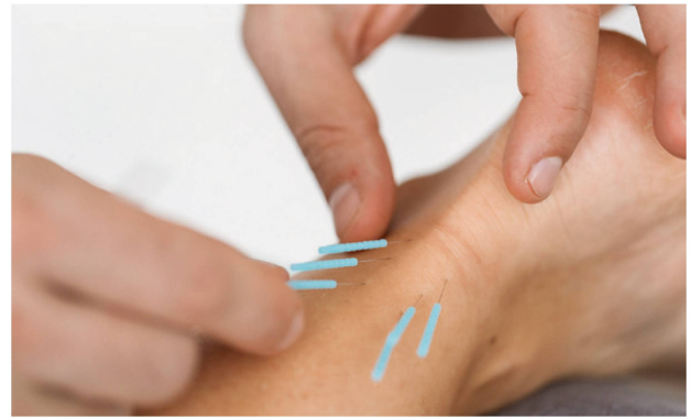
Superfizielle Affferenz-Stimulation. | Stimulation superficielles des afférences.

Das Dry Needling steht vor allem für die Behandlung von myofaszialen Schmerzen und Dysfunktionen, bei der ver-