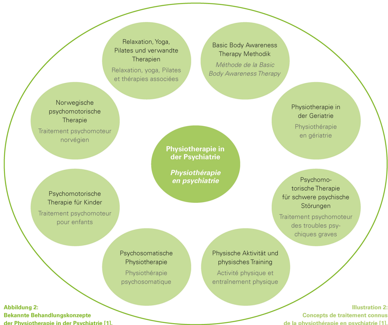
Abbildung 2: Bekannte Behandlungskonzepte der Physiotherapie in der Psychiatrie [1].