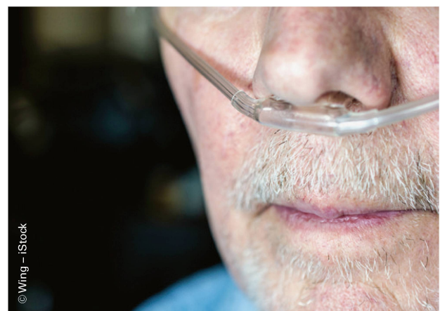
Psychische Probleme treten sehr häufig im Zusammenhang mit somatischen Erkrankungen auf. | Très souvent, l'apparition de problèmes psychiques est liée à des maladies somatiques.

Dans certains pays et dans certaines régions comme la Belgique, la Grande-Bretagne et la Scandinavie, le domaine de spécialisation de la physiothérapie en psychiatrie est une tradition. Dans ces pays, les physiothérapeutes sont déjà très engagés dans le domaine des prestations psychiatriques. En Suisse, la physiothérapie est moins établie en psychiatrie et son potentiel y est moins reconnu. Toutefois, les physiothérapeutes sont eux aussi trop peu conscients de leurs possibilités dans ce domaine et beaucoup de physiothérapeutes ne se sentent pas sûrs d'eux dans la gestion de problèmes psychologiques [7]. À l'avenir, il s'agit de s'efforcer d'amélio-