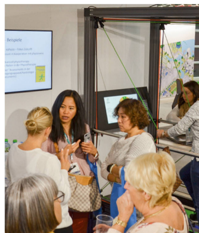
Persönlicher Austausch. | Des échanges personnalisés. | Scambi personalizzati.

Durant ces quatre jours, des contacts les plus divers se sont noués au sein de