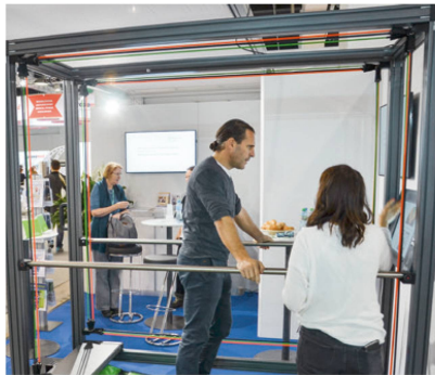
Der SensoPro als Eye-Catcher. | Le SensoPro nous a permis d'attirer l'attention. | Il SensoPro ci ha permesso di essere visibili.

Nach angeregter Diskussion entschieden wir uns, die Vielfalt unseres Berufes darzustellen. Wir schrieben deshalb viele Fachgruppen und -verbände an. Die Resonanz und die Hilfsbereitschaft waren grossartig. Powerpoint-Slides wurden kreiert, Informationsflyer zugesandt. Der Inhalt des Stands nahm Gestalt an.