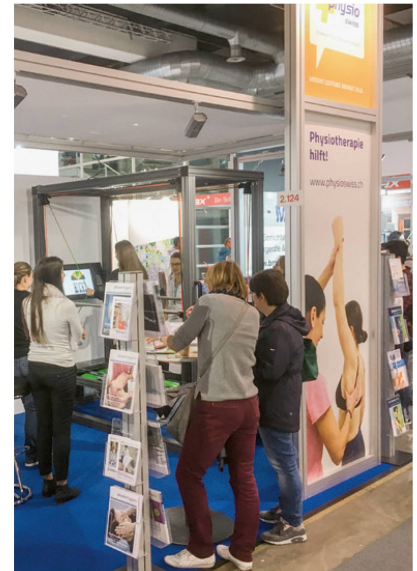
Beliebtes Infomaterial. | Du matériel d'information très apprécié. | Un materiale d'informazione molto apprezzato.

soluzione. Un dispositivo innovativo che si distingue già solo per la sua struttura. Permette di effettuare un training di coordinazione con un carico ed è molto facile da usare. Abbiamo quindi offerto un test su una gamba sola: le/i visitatrici/tori potevano testare e confrontare le loro abilità di equilibrio. Non appena alcune persone hanno iniziato a utilizzare questo dispositivo, più persone sono state attratte dal nostro stand.