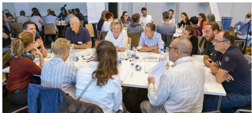
Die Chef-PhysiotherapeutInnen diskutierten den Experimentierartikel. | Les physiothérapeutes chef-fe-s échantent sur l'article d'expérimentation. | Le/i fisioterapiste/i capo-reparto discutano dell'articolo sperimentale.

Un consiglio di esperte/i arruolato dal Consiglio federale ha pubblicato, nell'agosto 2017, una relazione sulle «misure