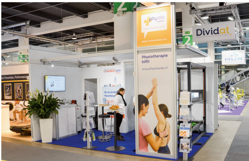
physioswiss war vom 23. bis 26. Oktober an der IFAS präsent. I physioswiss était présente à l'IFAS du 23 au 26 octobre. I physioswiss era presente all'IFAS dal 23 al 26 ottobre.

Ma come fare ad attirare i visitatrici e visitatori al nostro stand? Come associazione professionale in mezzo a tanti rappresentanti di imprese che possono offrire prodotti e novità, avevamo bisogno di un buon colpo d'occhio. Con il SensoPro abbiamo trovato una buona