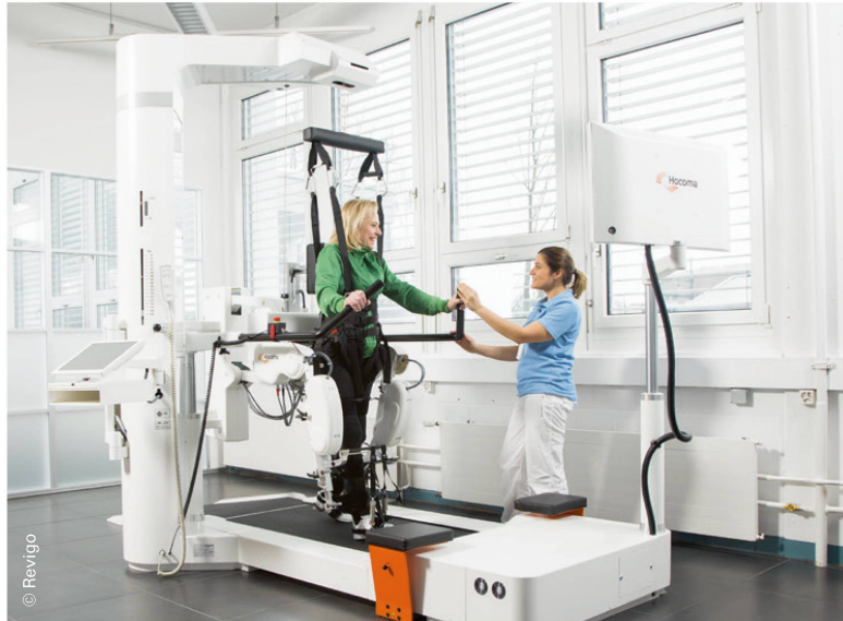
Gangroboter entlasten PhysiotherapeutInnen physisch und erweitern die Therapiemöglichkeiten. | Les robots de marche soulagent physiquement les thérapeutes et élargissent les possibilités de la physiothérapie.

In den kommenden Monaten wird Revigo und seine involvierten Partner zusammen mit dem Krankenversicherer Swica eine Studie durchführen, welche die Effekte einer technologieassistierten Bewegungstherapie bei der Gangtherapie nachweisen soll. Zentral dabei sind die Kriterien der Wirksamkeit, Zweckmässigkeit und Wirtschaftlichkeit. Ein weiteres Ziel dieser Studie ist es, die Akzeptanz einer solchen technologieassistierten Bewegungstherapie zu fördern.