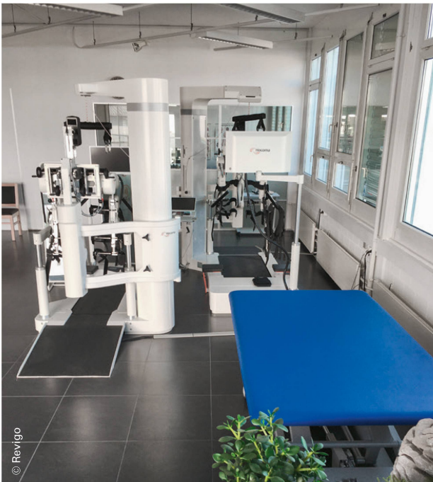
Gang- und Armroboter ermöglichen ein hoch repetitives Training. | Les robots pour les bras ou pour la marche permettent une forme d'entraînement très répétitive.

Mit der Robotik ist die Technisierung und Digitalisierung im Gesundheitswesen auch in die Physiotherapie eingezogen. Damit ergeben sich Möglichkeiten, die zu einem intensiven und individuellen Bewegungstraining, zur Dokumentation der Fortschritte, zu grösserer Effizienz als auch zu neuen Therapiemodellen führen. Dabei gilt es die Befürchtungen ernst zu nehmen, dass PatientInnen künftig nur noch mit Maschinen interagieren und TherapeutInnen überflüssig würden.