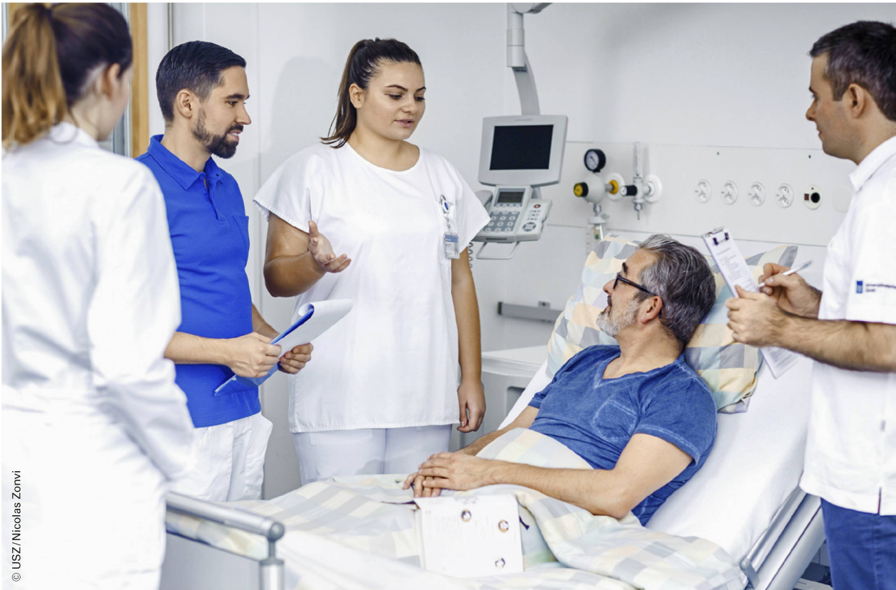
Die PatientInnen sind Teil der interprofessionellen Teams. | Les patient-es font partie de l'équipe interprofessionnelle.

Informationen wären für die Pflege relevant? Und was müsste der Arzt jetzt wissen? Mein Horizont hat sich durch die Zusammenarbeit stark erweitert», berichtet eine Physiotherapie-Studierende rückblickend.