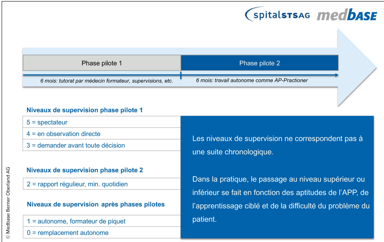
Niveaux de supervision découlant de la formation continue pratique des futurs médecins généralistes.

tember 2020 in Bern gestartet. Die beiden zukünftigen AP-Practitioner werden nun «on the job» während sechs Monaten von einer Lehrärztin in die neue Rolle eingeführt und engmaschig begleitet. Die Projektphase 1 ist in drei Stufen der Supervision aufgeteilt, welche sich nach der in der Schweiz etablierten Ausbildung für angehende HausärztInnen orientieren. Nach sechs Monaten folgt die Projektphase 2. Ab diesem Zeitpunkt werden die AP-Practitioner die PatientInnen in der Medbase Zweisimmen selbstständig untersuchen und in punktueller Rücksprache mit der Ärzteschaft vor Ort die erforderliche weitere Abklärung und Behandlung koordinieren.