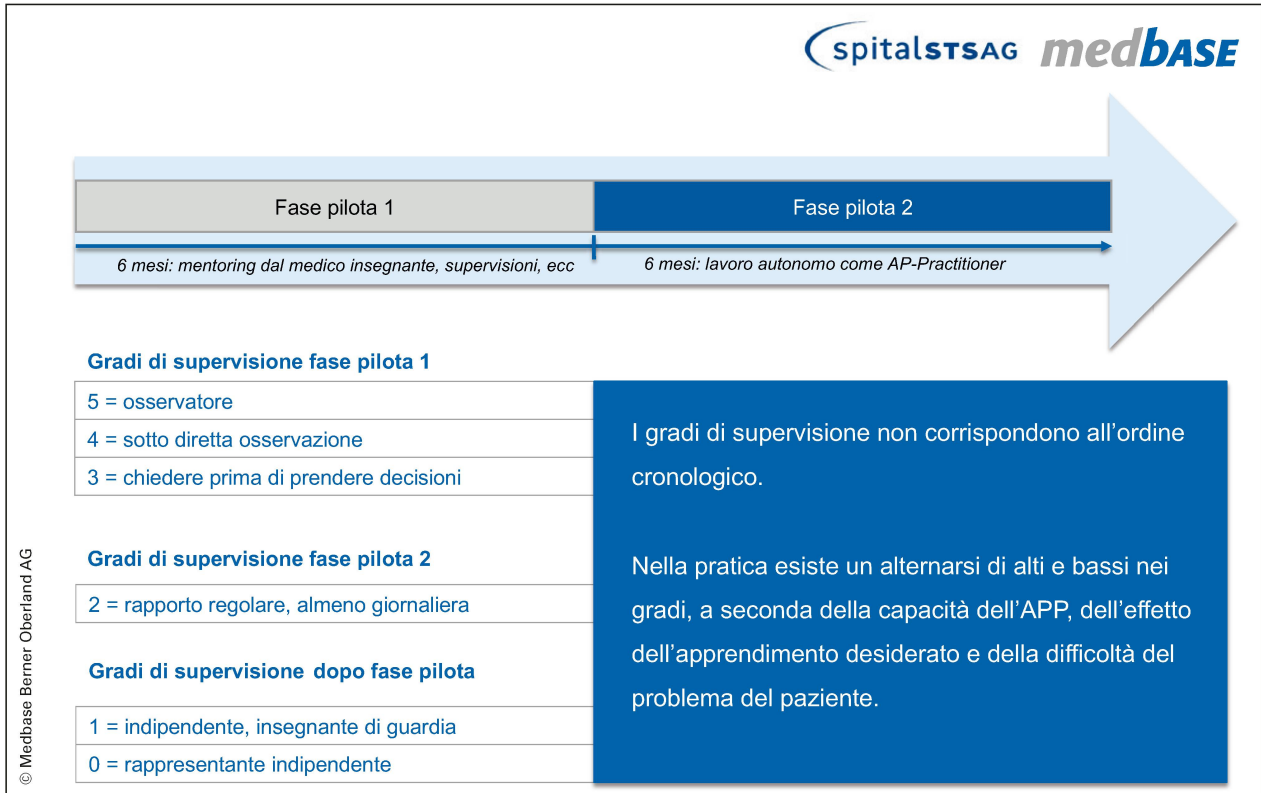
Gradi di supervisione associati alla formazione pratica continua per futuri medici generici.

Tests anordnen. Danach haben sie die Möglichkeit Medikamente, bildgebende oder therapeutische Massnahmen in Rücksprache mit der Hausärztin bzw. dem Hausarzt und unter deren Verantwortung anzuordnen. Sie werden selber keine physiotherapeutischen Behandlungen durchführen, sondern PatientInnen im gegebenen Fall an die ortsansässigen Physiotherapiepraxen weiterweisen.